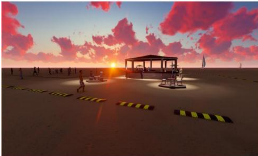
Proyecto El Caribeño