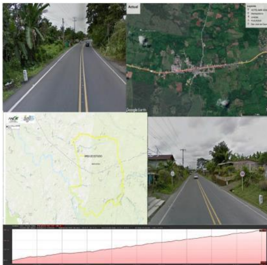
Figura 2. Localización tramo vial Actual y área de estudio.